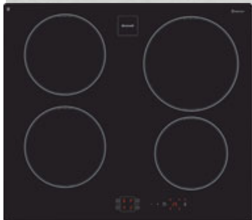
Table de cuisson